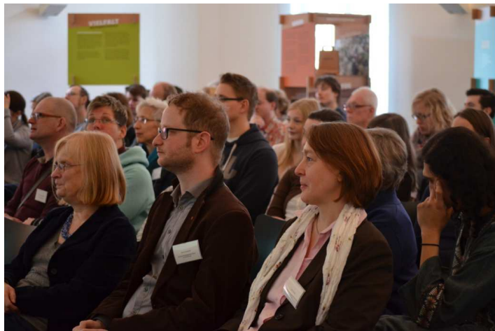
Bremen & Niedersachsen