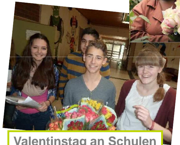
Valentinstag an Schulen