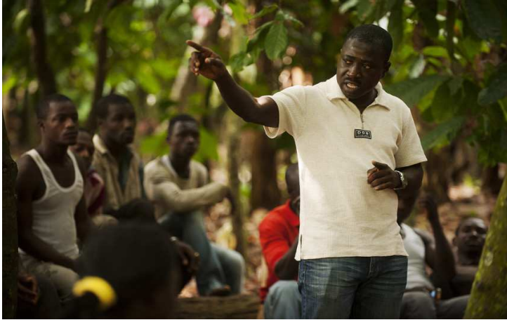
Mehr in den Süden