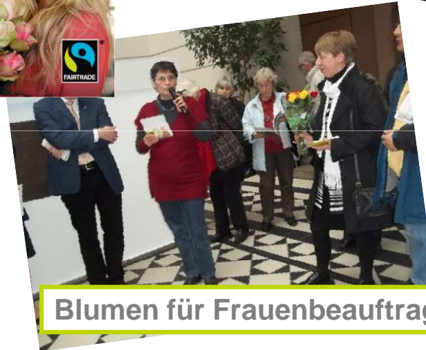
Blumen für Frauenbeauftragte