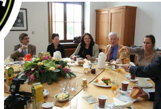
Frühstück im Neusser Rathaus