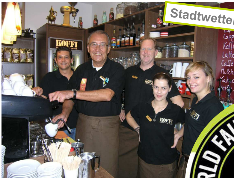
Stadtwetten gegen Politiker