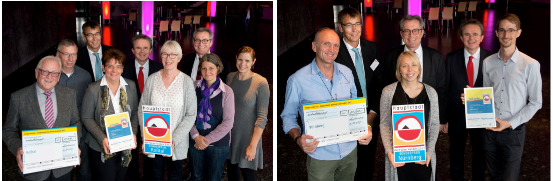
Bild oben: Roßtal und Nürnberg nehmen ihre Auszeichnungen entgegen

Gleich zwei Sonderpreise konnte Mittelfranken beim diesjährigen Wettbewerb Hauptstadt des Fairen Handels entgegen nehmen. Nürnberg und Roßtal wurden jeweils für Ihr Engagement rund um nachhaltige Beschaffung ausgezeichnet. Während eines Festaktes beim bisherigen Titelträger Saarbrücken nahmen die VertreterInnen der Kommunen den Preis entgegen. Weitere Auszeichnungen gingen nach Dortmund, Mainz, Trier, Hagen im Brehmischen, Karlsruhe und Wesel. 2017 bewarben sich 100 Kommunen – so viele wie noch nie – mit 905 Projekten. Erstmals wurden 250.000€ Preisgeld ausgeschüttet.