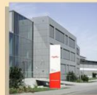
Abb. 1: Firmensitz, DEHN