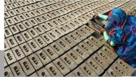
Verbot von Zwangs- und Pflichtarbeit