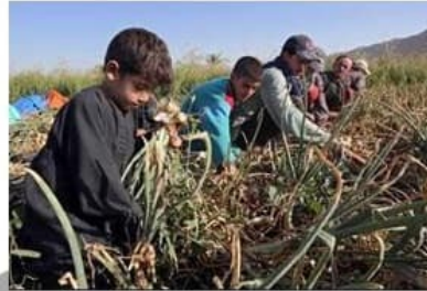
Verbot ausbeuterischer Kinderarbeit