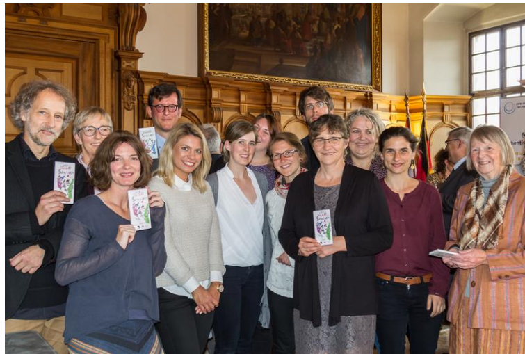
1 Zum Jubiläum überreichten die Eine Welt-Regionalpromotorinnen den Vorständen des EWNB e.V. je eine Tafel SeenLiebe Schokolade

Der aktuelle Rundbrief „April 2019“ aus dem Eine Welt Netzwerk Bayern e.V. mit vielen Infos aus den Mitgliedsgruppen und Glückwünschen zu 20 Jahren Eine Welt Netzwerk Bayern e.V. hier: www.eineweltnetzwerkbayern.de/ewnb/rundbrief