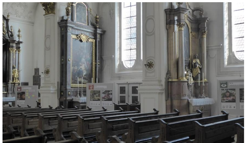
Fairtrade-Foto-Ausstellung in der Stadtpfarrkirche Maria Himmelfahrt

Vom 15. bis zum 31. Juli haben Steuerungsteam der Fairtrade-Stadt Weilheim und das neu gegründete Umweltteam der Katholischen Pfarreiengemeinschaft Weilheim die Fairtrade-Foto-Ausstellung von TransFair e.V. in der Stadtpfarrkirche Mariä Himmelfahrt gezeigt. Siehe Artikel im Kreisboten . Außerdem