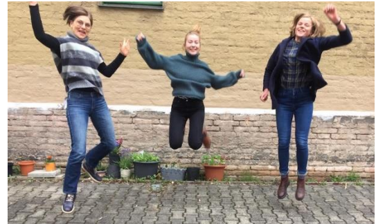
Die Mitarbeiterinnen von BtE Bayern

Erfahrungen aus dem Globalen Süden und Migrant*innen aus dem Globalen Süden zu Bildungsreferent*innen des Globalen Lernens, unterstützt Veranstalter bei der Konzipierung von Bildungsveranstaltungen und Projekttagen zu Themen des Globalen Lernens und organisiert Fort- und Weiterbildungen zu Inhalten und Methoden des Globalen Lernens. Zielgruppe sind Multiplikator*innen: Lehrkräfte, Erzieher*innen und Akteure in der Erwachsenenbildung. Bildungsveranstaltungen des Globalen Lernens ( https://www.eineweltnetzwerkbayern.de/globales-lernen.shtml ) finden in Kindergärten, Schulen, Hochschulen, Einrichtungen der außerschulischen Jugend- und Erwachsenenbildung sowie in Kooperation mit weiteren interessierten Gruppen statt. Durch ihre persönlichen Erfahrungen geben die Bildungsreferent*innen des Globalen Lernens authentische Einblicke in weltweite Zusammenhänge und ermöglichen so einen Perspektivenwechsel auf die Themen und Herausforderungen der Globalisierung.