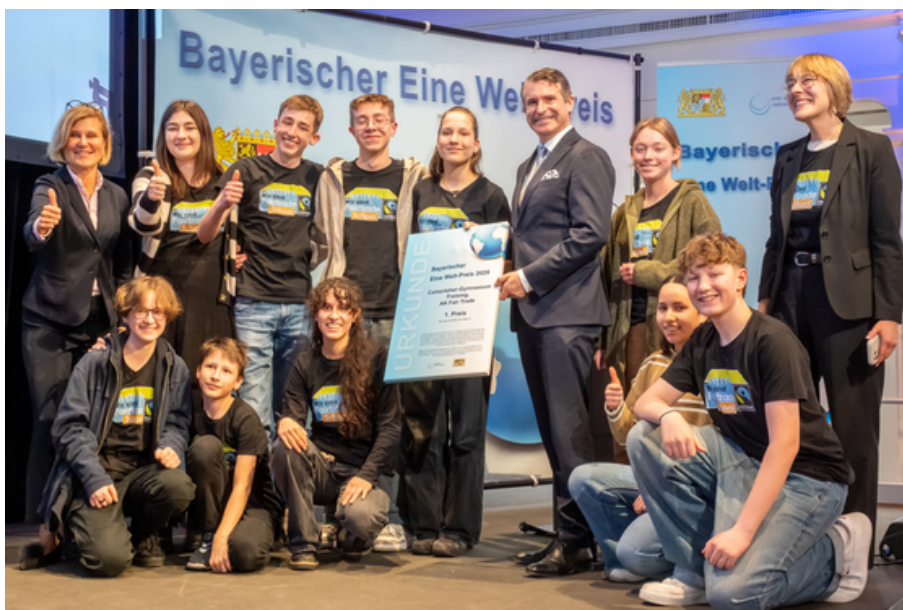
AK Fair Trade des Camerloher-Gymnasium Freising.

Aktion Eine Welt e.V. Bad Neustadt Divinity Foundation Europe e.V. Johann-Michael-Fischer Gymnasium Burglengenfeld Long Yang e.V. Montessori-Pädagogik Forchheim e.V. SchuPa Tansania e.V. Solidarität in der Einen Welt e.V. (Langquaid) Sonderpreis für Kommunen: (je 500 Euro): Städte Aschaffenburg & Gersthofen