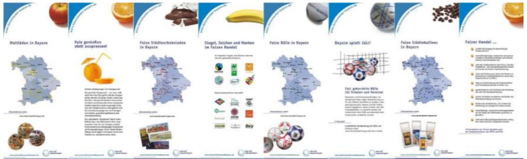
Ausstellung zum Fairen Handel des Eine Welt Netzwerks Bayern

Stark reduziert und wahrscheinlich gerade deshalb so beeindruckend. Keine langen Texte, keine Grafiken, keine Zahlen. Nur Fotos aus den Ländern des Südens kombiniert mit gängige Aussagen aus dem bundesdeutschen Alltag. Gerne können Sie die Ausstellung für eigene Veranstaltungen ausleihen. Bei Interesse wenden Sie sich bitte an: verwaltung@eineweltnetzwerkbayern.de . Darüber hinaus bietet das Eine Welt Netzwerk Bayern ausleihbare Roll-ups an zu den Themen: Fairer Handel, den SDGs und Bayern gegen ausbeuterische Kinderarbeit.