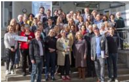
Alle Teilnehmer:innen vor dem Eine Welt Haus in München