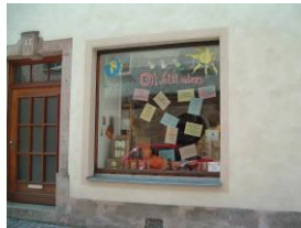
3. Weltladen bis 2007

Mitte bis Ende Juni dann im Landkreis Wunsiedel