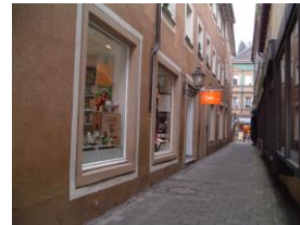
Weltladen von 2007 bis 2016

Fair Weltladen seit 2016 am Sandwichständer: Isabel Liphay, Duo Contraviento anlässlich 25 Jahre Weltladen