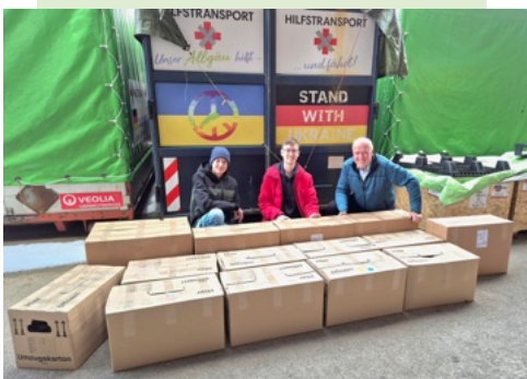
Text: Sabine Zeeh