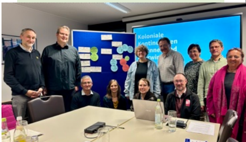
Bilder: Miriam Fontes