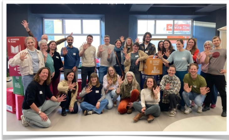
Vernetzungstreffen Globales Lernen in Kempten, Bild: Miriam Fontes

Gerne nehme ich Ihre Informationen, Veranstaltungshinweise oder Termine in den Rundbrief mit auf. Auch über Feedback oder Anregungen freue ich mich: promotorin@weltladen-kempten.de , Mobil: 0160 96537013.