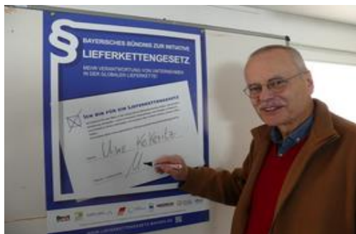
Grünen-Bundestagsabgeordneter Uwe Kekeritz beim Unterscheiden des Plakats.

Die Initiative tritt ein für eine Welt, in der Unternehmen Menschenrechte achten und Umwelterstörung vermeiden – hierfür fordert sie einen gesetzlichen Rahmen.