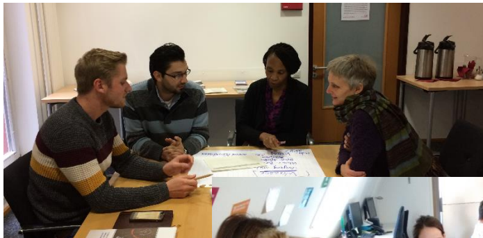
ReferentInnen bilden sich regelmäßig fort und tauschen sich untereinander aus.